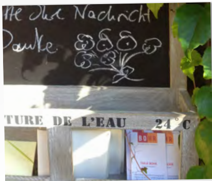
SCHÖN, DASS SIE DA SIND !